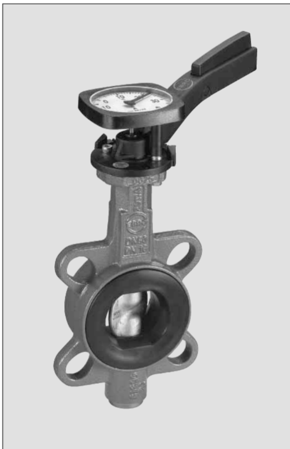
Заслонка с промежуточным фланцем тип Z011-A с интегрированным термометром. Это исполнение может также поставляться для типа Z014-A.