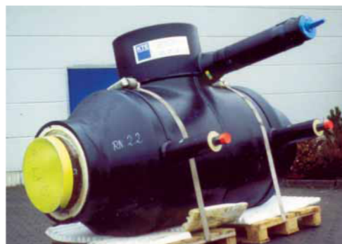
Предизолированный шаровый кран «Баллостар»: до, во время и после установки на трубопроводе.

Данные шаровые краны тестированы по EN 488 (подземная установка). Исполнение с предизоляцией по запросу – см. рядом стоящие рисунки. Телескопический удлинитель штока по запросу.