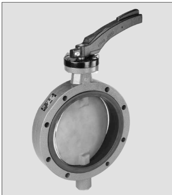
Запорная заслонка для автоцистерн тип TW 200 с манжетой NBR